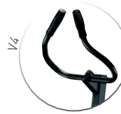
Lenkstange ausschwenkbar und einstellbar in der Höhe