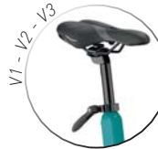
Sattel einstellbar in der Höhe