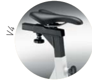
Verstellbarer Sattel in der Höhe und in der Tiefe