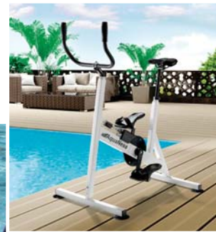
Aquafitness im Schwimmbaden wie im Spa