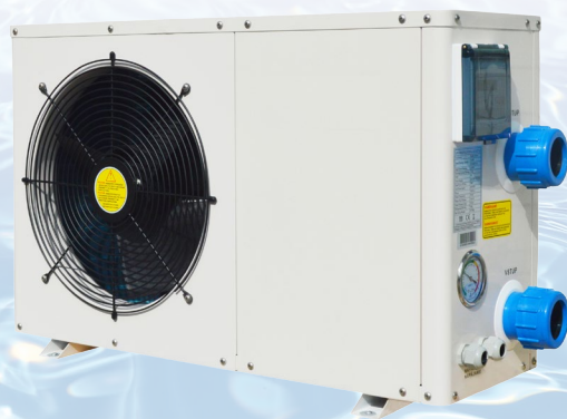
Abbildung TOP+ Wärmepumpe