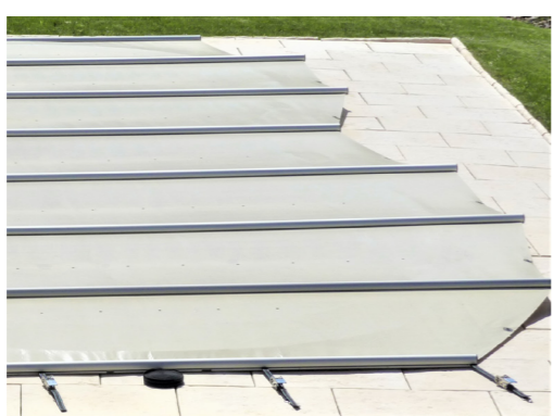
Abgeflachtes Profil-Endstück (Randschutz)