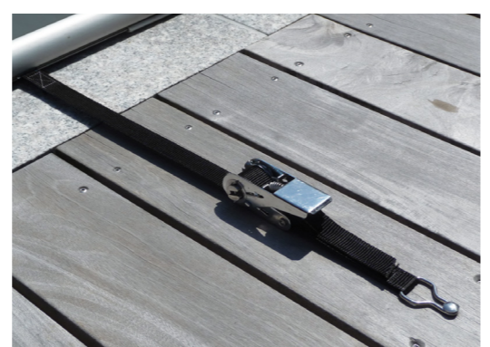
Edelstahlratsche mit Gurt und Ring (seitlich und in der Tiefe verstellbar)