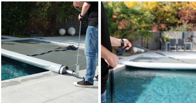
Aufrollen mit Handkurbel